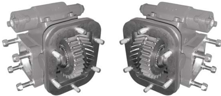
Lado Izquierdo Left Side