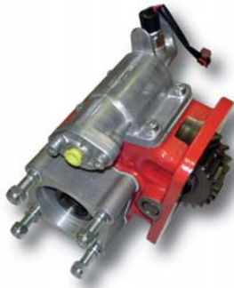
Lado Izquierdo Left Side