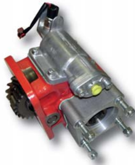
Lado Derecho Right Side