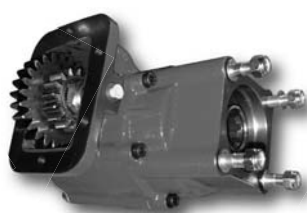
Posición 1 Position 1

Toma de fuerza de 6 taladros, 2 piñones con embrague incorporado. Accionamiento neumático e hidráulico. Montaje sobre ambos lados de la caja de cambios. Diferentes relaciones de transmisión.