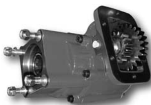
Posición 3 Position 3