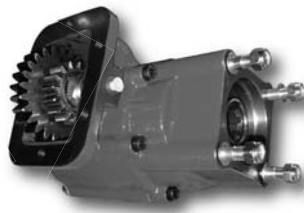
Posición 1 Position 1

Toma de fuerza de 6 taladros, 2 piñones con embrague incorporado. Accionamiento neumático e hidráulico. Montaje sobre ambos lados de la caja de cambios. Diferentes relaciones de transmisión.