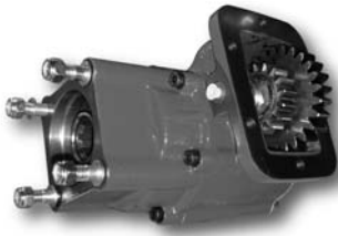
Posición 3 Position 3